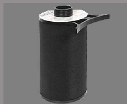
Filtr wylotowy Activac II