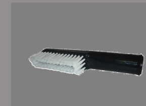
Ssawka długa elastyczna 65cm + mop do polerowania + szczotka do ścian i ubrań